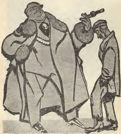
Рис. А. Радокова.